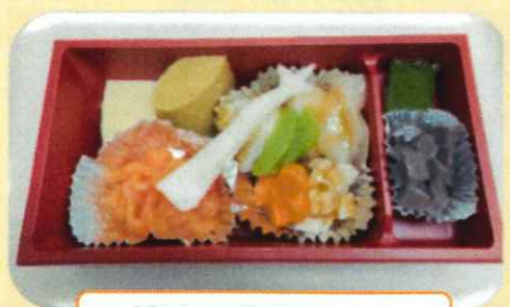
ゼリー食のおせち