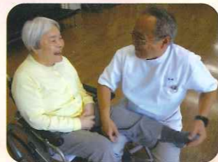
笑顔のリハビリ風景

特定の期間、集中的に毎日リハビリを行える「短期集中リハビリ」や「認知症短期集中リハビリ」を選択できます。これらを活用することにより、まだ骨折後のリハビリが十分にできていない利用者様に対して毎日リハビリを行う事で身体機能の向上を目指すことや、認知症により新しい環境に慣れない事で周辺症状が増加してしまっている利用者様に対しては、多く介入する事で早く環境に慣れて頂くような活用ができます。