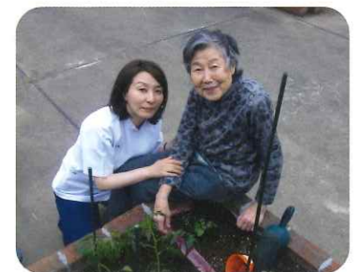
利用者様と育てます

例えば、日々の変化を実感しづらい利用者様に種から作物を育ててもらおう事で、明日が来る事の喜びを感じて頂いたり、数人のグループで植えから収穫までの共同作業を行う事で利用者様どうしの繋がりが生まれたり、普段のフロアでの生活にもプラスとなるような反応を得る事ができました。今後、育てた作物を皆で調理して食べることで利用者様の喜びに繋がればと考えております。