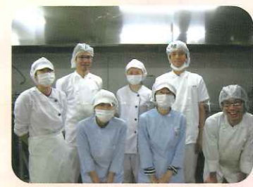
愛を込めて作ります!

栄養科では、管理栄養士3名、調理員13名で食事面でのサポートをしております。利用者様、一人一人に合わせたお食事を提供させていただき、今年からは、飲み込みが困難でも食べやすい食事形態である【ゼリー食】を導入しました。その他にも、毎月の皆様のお誕生会ではお刺身や五目寿司などを提供して食事をする楽しさも提供しています。